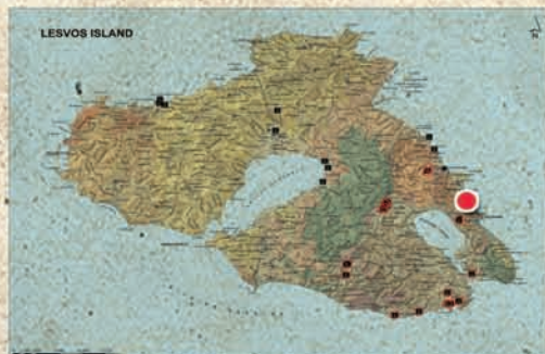
● Θέση Λατομείου / Quarry site