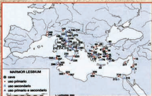
Χάρτης μνημείων σε περιοχές της Μεσογείου όπου χρησιμοποιήθηκε το μάρμαρο της Μόριας. Map of the monuments in the Mediterranean area where the marble of Moria has been used.